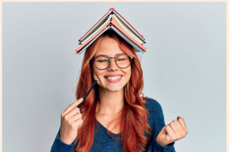
Eine Frage der Haltung: Wer aufrecht durchs Leben geht, hilft dem Rücken und der Seele – das zeigen Studien.

In diese Meta-Analyse gingen 70 Studien zum Thema Psyche, Körperhaltung und Bewegung ein. Zusätzlich führte der Professor für Klinische Psychologie und Psychotherapie eigene Studien zu den Auswirkungen von Körperhaltung und Bewegung auf depressive Patienten durch. Das erstaunliche Ergebnis: Menschen, die eine zusammengesunkene Körperhaltung einnahmen, behielten vermehrt negative Dinge im Gedächtnis. „Sie erinnerten sich