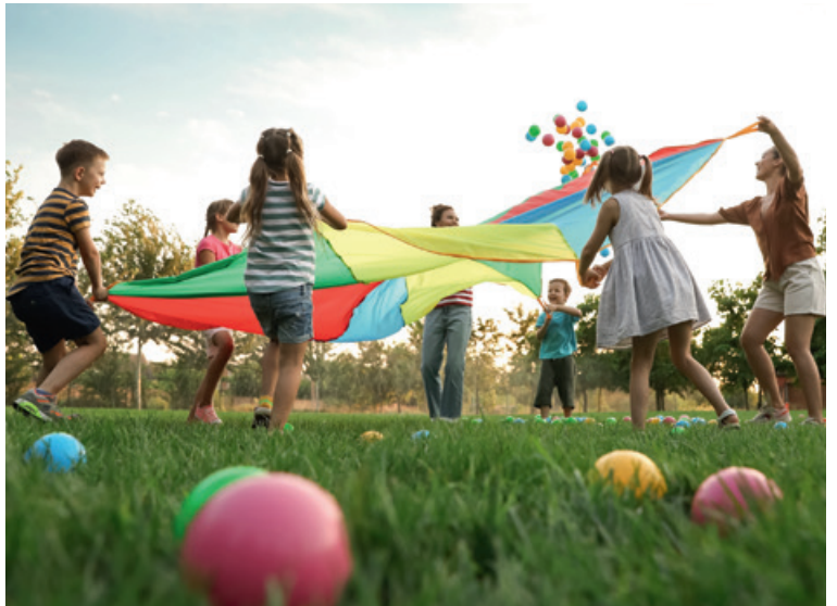
Freizeitaktivitäten, Bewegung und Sport fördern den Muskelaufbau ganz spielerisch.

Spielen Aktivitäten im Alltag eine wichtige Rolle? Stimmt es, dass Kinder immer träger werden? Schließlich ist ihnen doch ein natürlicher Bewegungsdrang in die Wiege gelegt, oder? Die Babywippe in Schwingung zu versetzen und die Welt zu erkabbeln, ist für die Kleinsten selbstverständlich. Die Basis für ein „bewegtes“ Leben wird bereits im Kindergartenalter gelegt.